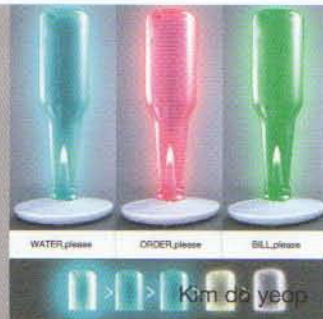
WATER please ORDER please BILL please

一個空的廢棄玻璃瓶有什麼功用？由韓國設計師Kim do yeop賦予空瓶新的角色，轉化成科技感十足的LED燈。此設計背後的概念相當實用化，當你在餐廳等待服務生點餐時，不需要拼命揮動你的雙手或是大喊，只要使用此精巧的小工具，透過顏色、光的頻率就能讓服務生注意：點餐=粉紅色燈；水=藍燈；呼叫=綠燈。不僅LED燈具有節能的功效，回收玻璃瓶更具有環保的概念，可謂環保與設計結合的最佳示範。