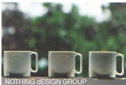
NOTHING DESIGN GROUP